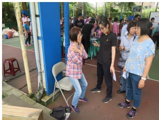
社區長者參與高齡體適能檢測情形