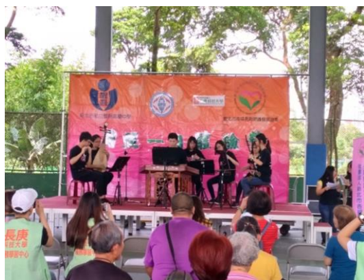
嵐逸國樂社學生精彩演奏揭開活動 序幕