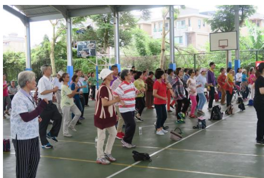
長者專注的參與活動情形