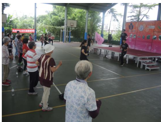
高齡學程師生帶來的銀髮族體適能- 「萬歲操」教學