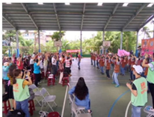
銀齡樂活據點的阿公阿嬤帶來的 Zumba Gold 銀髮族健康舞蹈