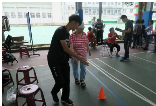
社區長者參與高齡體適能檢測情形