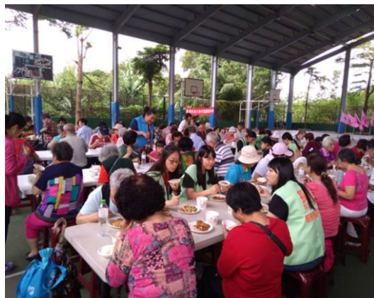
參與服務的師生與長者共餐、話家常， 提前與社區的阿公阿嬤歡慶端午佳節