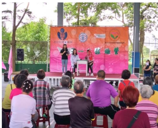
護理系學生為長者進行預防高血壓 衛教宣導