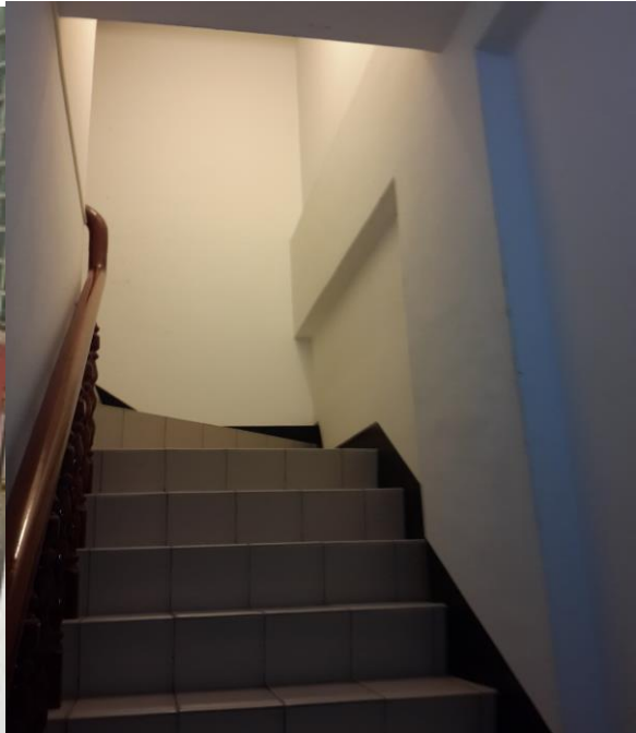
000 老師視訊軟體關懷 O 技護理 000 班 000—(消防通道及滅火器) (學生賃居地址：_____)