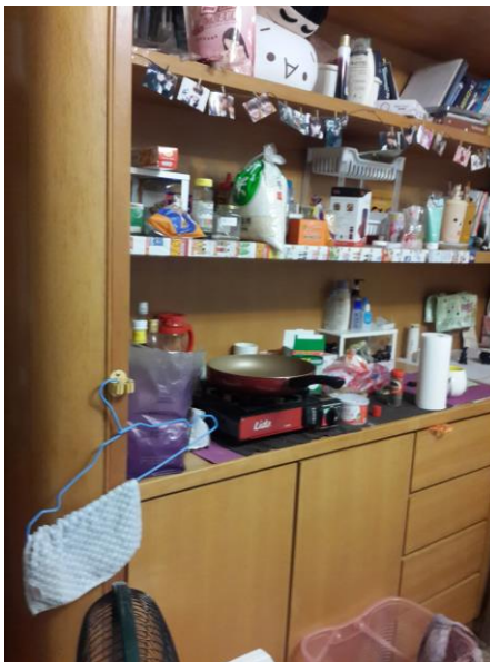
000 老師視訊軟體關懷 O 技護理 000 班 000—(房門口及部份陳設) (學生賃居地址：_____)

活動名稱：114 學年度第 2 學期賃居校外學生訪視 活動日期：115 年 月 日 承辦單位：學務處學生安全輔導組