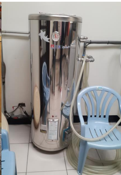
000 老師視訊軟體關懷 O 技護理 000 班 000—(電源、插頭及熱水器) (學生賃居地址：_____)

活動名稱：114 學年度第 2 學期賃居校外學生訪視 活動日期：115 年 月 日 承辦單位：學務處學生安全輔導組