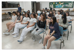
庚心家族 - 輔導幹部學長姐們