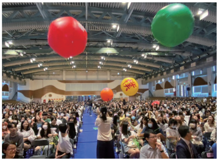
開學典禮 - 勤勞樸實接力傳球

113 學年度新鮮人探索營以「庚新啟航 - 「EXPLORE 長庚・Dreams come true」為主題，展開系列定向輔導方案，新生營期間將由師長協助指導充滿熱忱的 ACE Leader 學長姐們，透過營隊形式，結合各系未來特色發展，用心規劃設計邁向五師（護理師、營養師、長照師、幼保師及醫美師）之路系列探索活動，包含：典範學習探索、自我探索、學長姐傳承、ACE Leader 相見歡、環境學習探索、專業學習探索、社團博覽會及開學典禮等活動，引領新生在學習的過程中，多方廣泛吸收新知，具備創意思考及多元跨領