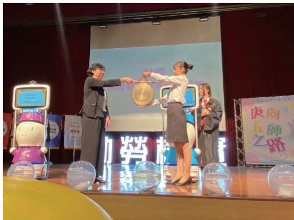
開學典禮敲鑼 傳遞勤勞樸實校訓精神

本校以「勤勞樸實」校訓為基礎，配合「三階十德」、「品德美」及「三好校園」品德教育發展為目標，並以「健康照護」為發展主軸，養成術德兼修有品的專業照護人才。由各系學生組成的「庚心家族源『緣』流長」ACE Leader 同儕輔導幹部領導團隊，今年度培訓持續結合「領袖魅力 - 跨領域社團領導與實作」跨域微學分課程，以設計思考教學模式，規劃最佳新生定向輔導方案，輔導幹部將於新生營期間發揮所學，以學長姐帶領學弟妹傳承的心，協助新生融入校園學習氛圍，以正向、多元的態度擁抱大學新生活。