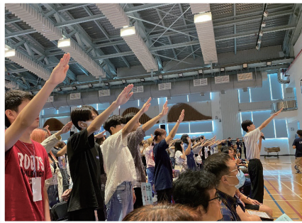
全體新生開學宣示

域能力，以面對快速變化的世界以及新型態工作的來臨。新生定向活動主要目的以協助新鮮人建立人際關係、融入校園生活及規劃學習藍圖，奠定進入大學的「第一哩路」，期許新鮮人進入大學後，發揮校訓「勤勞樸實」的精神，培養長庚六力（創造力、思考力、合作力、服務力、健康力、就業力）、五師要素（專業、冒險、判斷、熱忱、合群、勤奮）及六心（初心、決心、細心、熱心、耐心、恆心）等特質，設定未來目標方向，朝向五師之路邁進，期許未來成為兼具跨領域廣度及專業深度的「T 型人才」（T-shaped talent）。