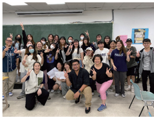
113 新生同儕輔導學長學姊

作為庚心家族 ACE Leader 的輔導學長姐們，已經準備好法寶帶著挑戰和充滿熱情的心，陪伴初次你們一起踏入大學校園，希望你們能夠在長庚科大創造滿滿的期待與感動，協助大家無縫融入校園生活及安定學習心情，一起營造溫馨友善的長庚校園文化，更期待每位新鮮人都能踴躍加入 ACE Leader 領導團隊，培養 A 積極活潑力 (Active Power)、C 創新、合作及思辨力 (Creative、Cooperative & Critical Power)、E 卓越力 (Excellent Power)，認真積極多元學習，如同稻穗花實飽滿謙虛，成為成長庚科大未來傑出領袖人才。