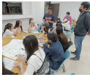
設計思考課程培訓