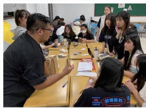
設計思考迷你工作坊