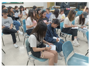
設計思考培訓課程

雖說這一趟，讓我們跑了很多地方，但也讓我和室友更認識學校以及周圍重要地標。週末出去時，都會看到有一些家長跟觀光客，來到志清湖旁野餐或欣賞湖面上的風景。也建議大家一起來探索 !!。