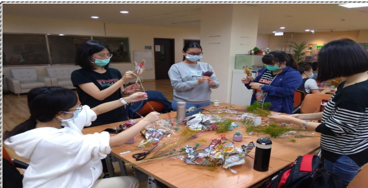
活動時間：109 年 11 月 18 日 活動名稱：「樂活環保-乾燥花手作坊」基礎課程(學員專注的創作情形) 辦理單位：服務學習中心