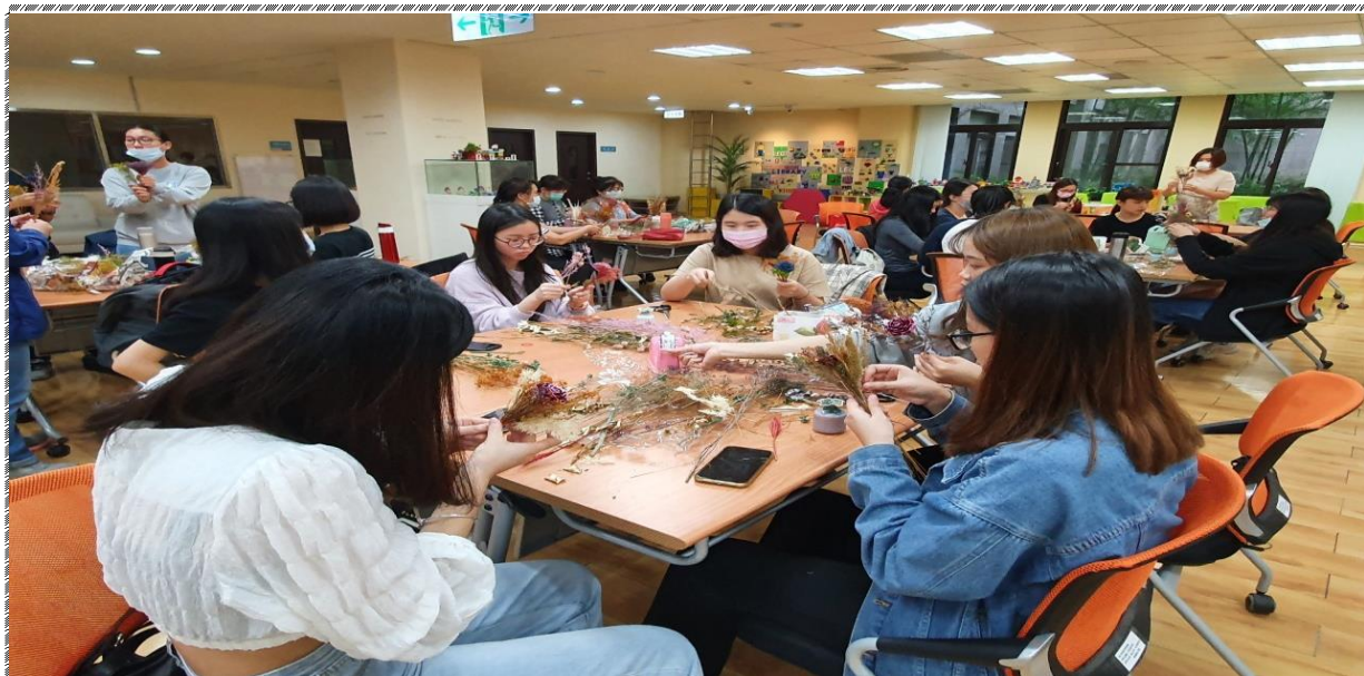
活動時間：109 年 11 月 18 日 活動名稱：「樂活環保-乾燥花手作坊」基礎課程(學員專注的創作情形) 辦理單位：服務學習中心